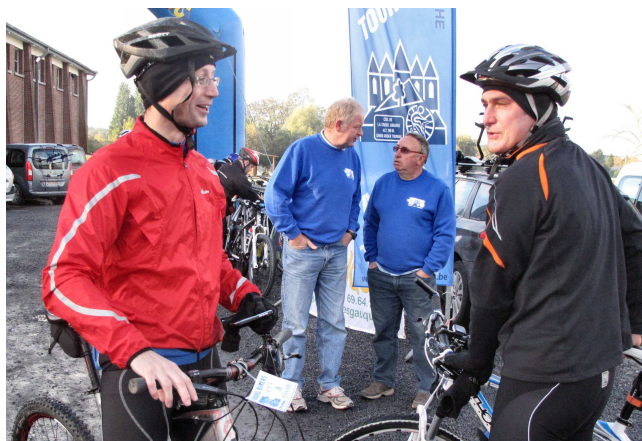
08) Préparatifs d'avant départ à l'école de Warchin.