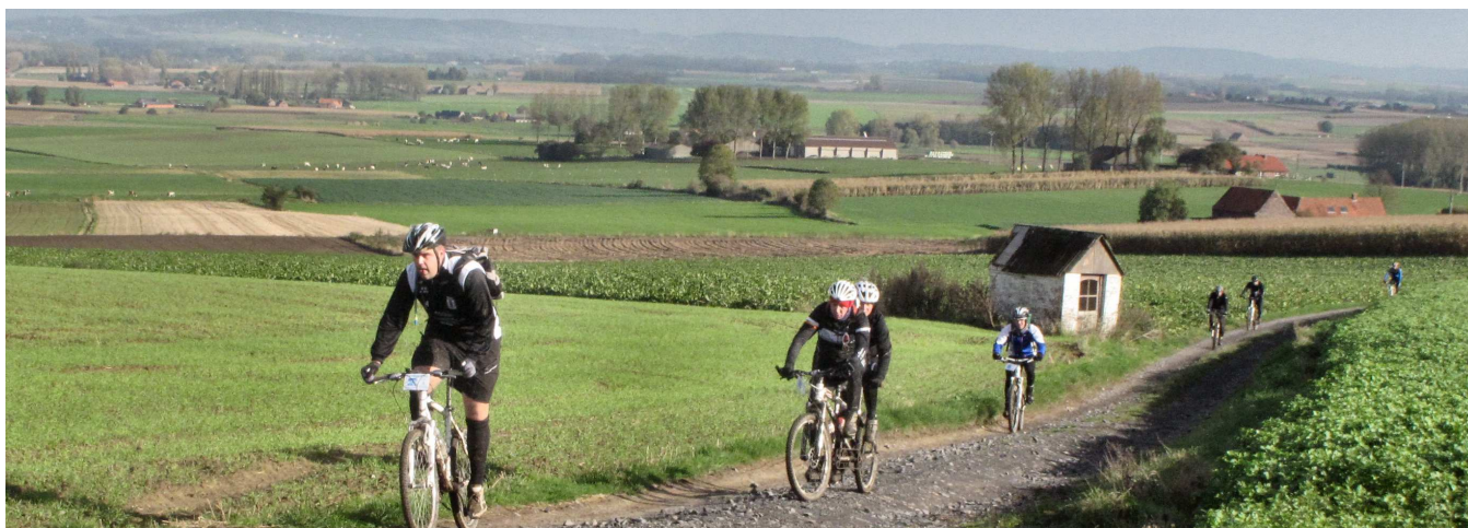
14) Escalade panoramique du Hameau du Bourdeau, avant de redescendre vers le ravito de la Grignotière.