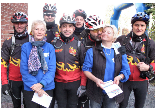
09) Il ne fallait pas tirer les Diables ... par la queue !