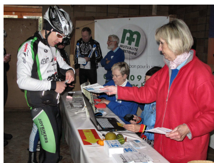
05) Documents cadeaux pour tous