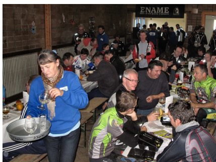
26) Consommation - récupération.