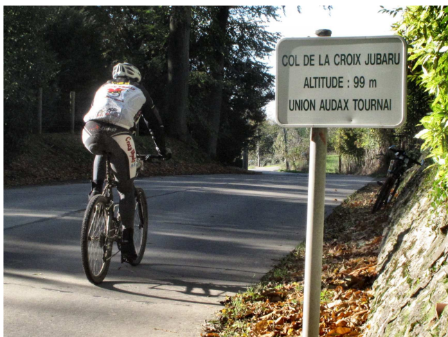
21) Premier col connu en Belgique, en 1985, avec un panneau mentionnant l'initiative des Audax Tournai