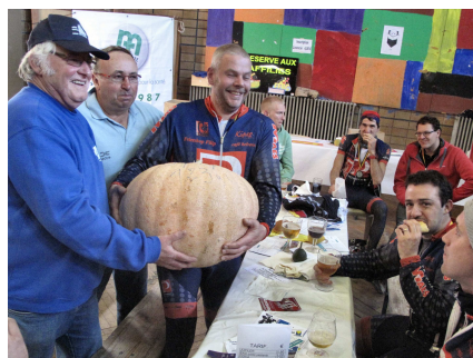
27) Ootiron chez un Krierecoxer.