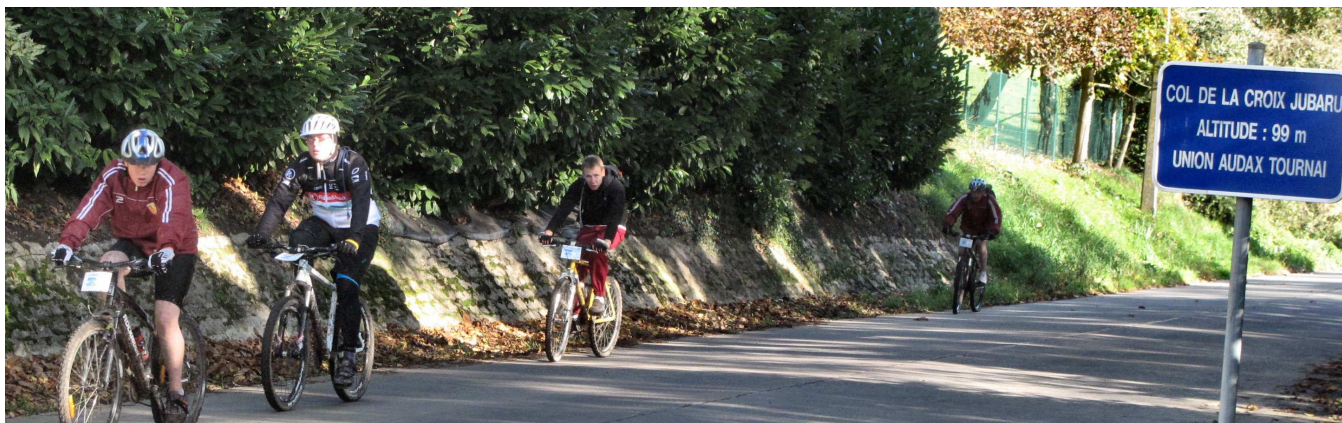
20) Le col de la Croix Jubaru passe en creux entre le Mt St Aubert (147m) et le Hameau du Bourdeau (126m).