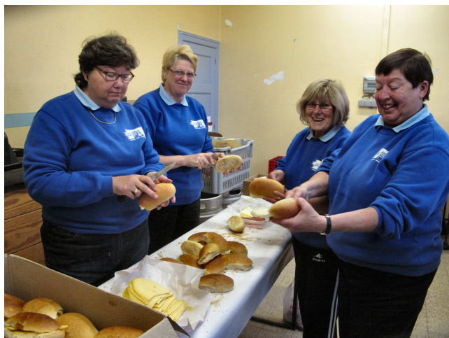
02) Les Audaxettes pour 684 pistolets fourrés au jambon ou fromage distribuée à l'arrivée.