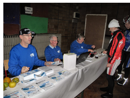
06) Inscription des non affiliés.