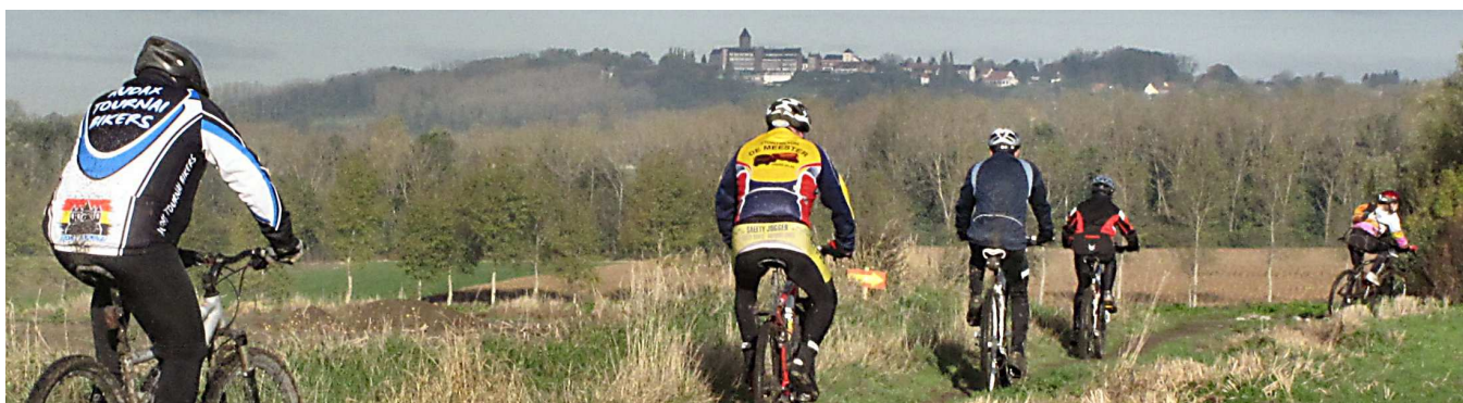
13) Beau temps sec mais frisquet pour prendre d'assaut le Mont Saint Aubert, face nord puis versant sud.