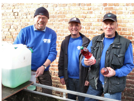
15) A boire chez les uns.