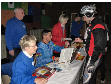
04) Inscription des affiliés.