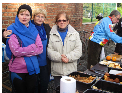
16) A manger chez les autres.