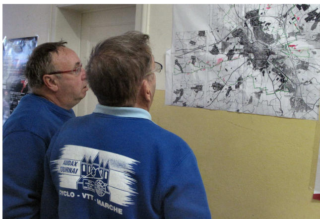
07) Le parcours arpente les flancs du Mt St Aubert.