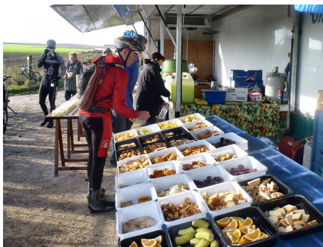
19) Superbe étalage de victuailles car les Audax se font une fierté de proposer des ravitos exemplaires.