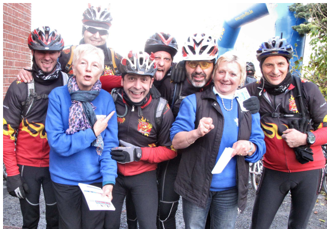
10) Ou alors ils l'agitent comme de beaux Diables !